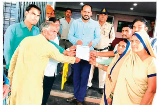
हरिभूमि न्यूज़ ॥ राजगढ़

15 अगस्त तक मांगें पूरी न होने पर निकालेंगे तिरंगा यात्रा